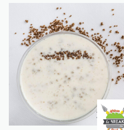
Dessert lacté avec grain de mil